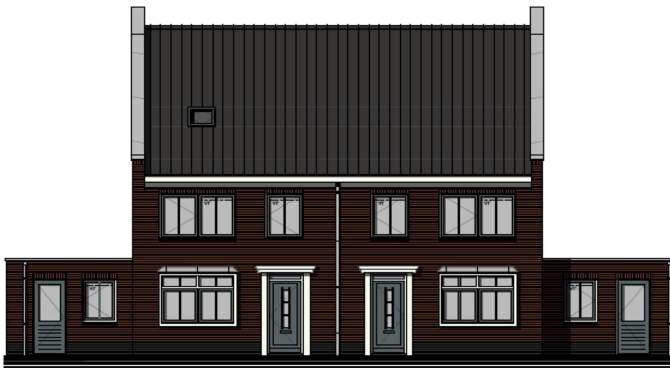
Bnr 18 en 19 zijn afgebeeld